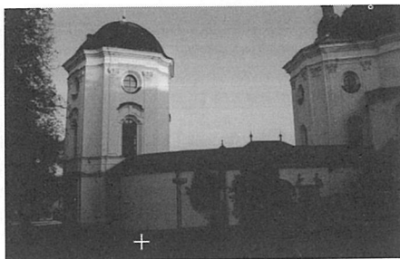
Obr. 3. Křtiny – poloha vchodu do nově objevené podzemní chodby pod S ambitem (označena křížkem) ve vztahu ke kapli sv. Anny a chrámu P. Marie.