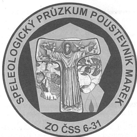
Obr. 2. Znak nové ZO ČSS 6-31.

Zasedimentovaná chodba dosahuje v místě zahliněného sifonu šířku cca 1,5 – 2 m. S největší pravděpodobností se podařilo objevit relikv dosud neznámého barokního kanalizačního řádu z 1. pol. 18. století sloužící k podzemnímu odvodnění a odvlhčení Santiniho stavby. Tento překvapivý objev nabude na významu zvláště pokud se z kanalizačního systému podaří objevit přípojku z podzemí samotného chrámu Panny Marie. Celková délka objevené chodby činí cca 17 m, a její další neznámé pokračování směřuje „ke křtinskému náměstí“. V přítomné chvíli je chodba zakonzervovaná a není možný do ní běžný přístup.