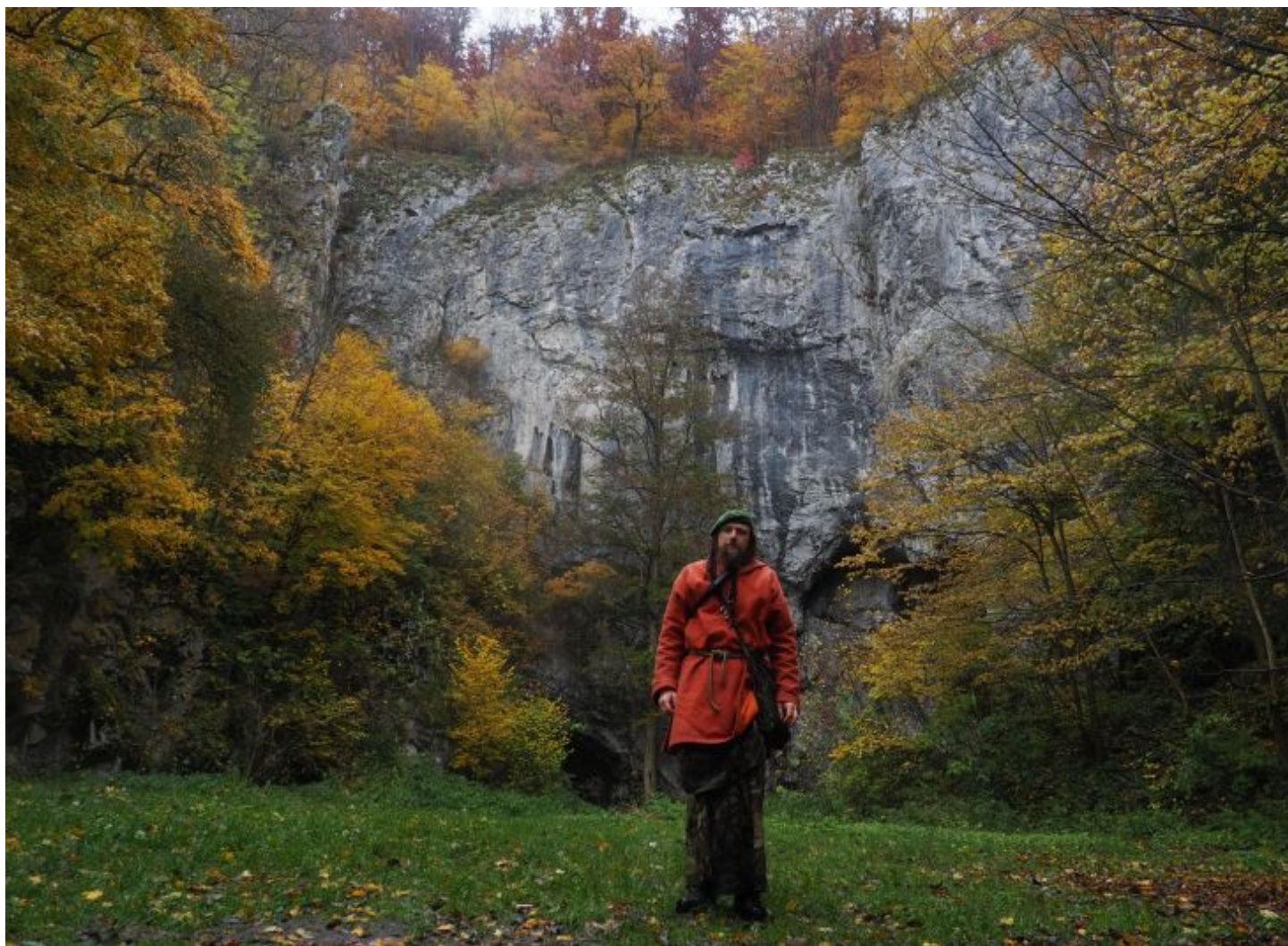
Autor tohoto článku před magickou jeskyní Býčí skála v roce 2020.